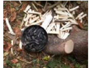
Purkissa ovat valmiit piirustushiilet.